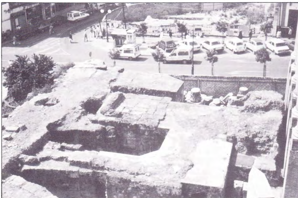
LÁMINA III. Detalle de la plataforma del altar con restos del zócalo y del pavimento original de la plaza.